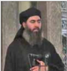
ابوبکر بغدادی سرکردگی دولت اسلامی عراق را به عهده گرفت.

یکی از گروه‌های عراقی که در برابر آمریکایی‌ها ایستادگی می‌کرد، با القاعده هم‌پیمان شد. به این ترتیب شعبه‌ای از القاعده در عراق شکل گرفت و فعالیت‌های خشونت‌طلبانه آن‌ها آغاز شد. بیشتر قربانیان آن‌ها دیگر آمریکایی‌ها نبودند، بلکه شیعیان عراقی بودند.